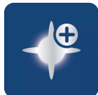
可达 6,000 K