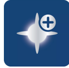
可达 6,000 K