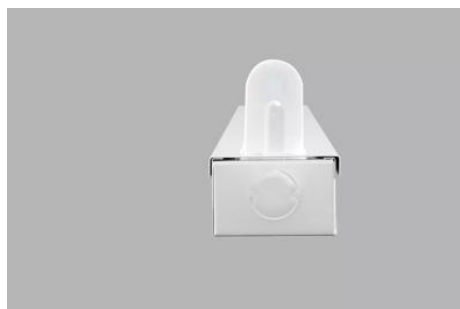
AirZing 5040 Product