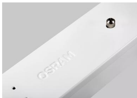
AirZing 5040 Product