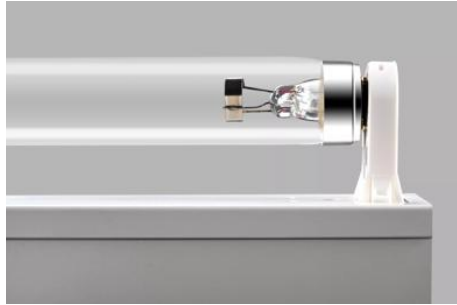
AirZing 5040 Product

PURITEC germicidal lamps emit high-intensity UV radiation that can cause sunburn and conjunctivitis. The skin and eyes must therefore not be exposed to direct or reflected unfiltered radiation.