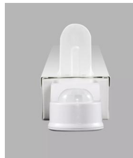
AirZing 5040 Product