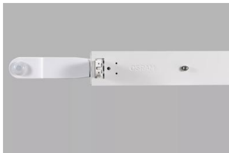
AirZing 5040 Product