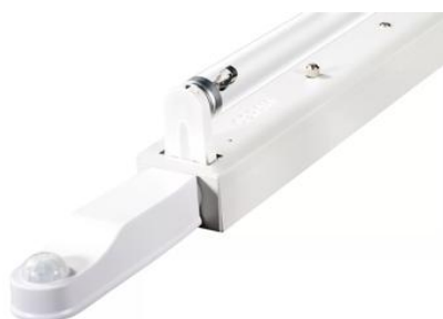
AirZing 5040 Product