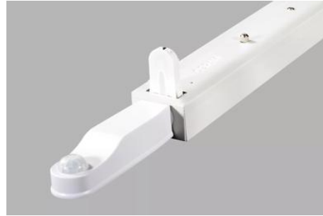
AirZing 5040 Product